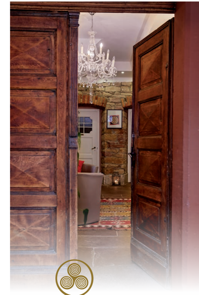
Layout: www.projektart.eu , 10/2017

16. Dezember HOLOTROPES ATMEN (TAGESSEMINAR)